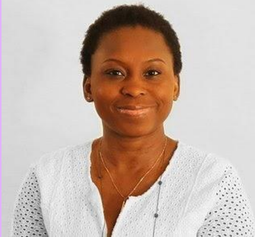
Lola Omolola, periodista y feminista de Nigeria. Puedes escucharla en esta conferencia a partir de 18:00.

Aisha Yesufu (1978) es una activista social nigeriana que saltó a la fama por su papel al defender a las estudiantes de Chibok , secuestradas en 2014 . Fue la convocante de la campaña Bring Back Our Girls (BBOG) que exigió el regreso de las 276 escolares secuestradas.