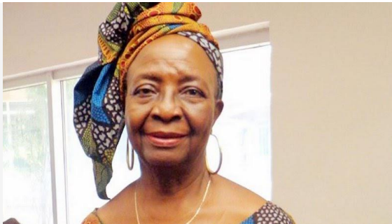
poscolonial en África.

Molara Ogundipe (1940-2019) fue una de las líderes de Women in Nigeria . Además de ser poeta, crítica literaria y feminista. Pronto destacó por sus textos marcados por el feminismo negro y poscolonial . Recomiendo leer los poemas que creó para Daughters of Africa (1992).