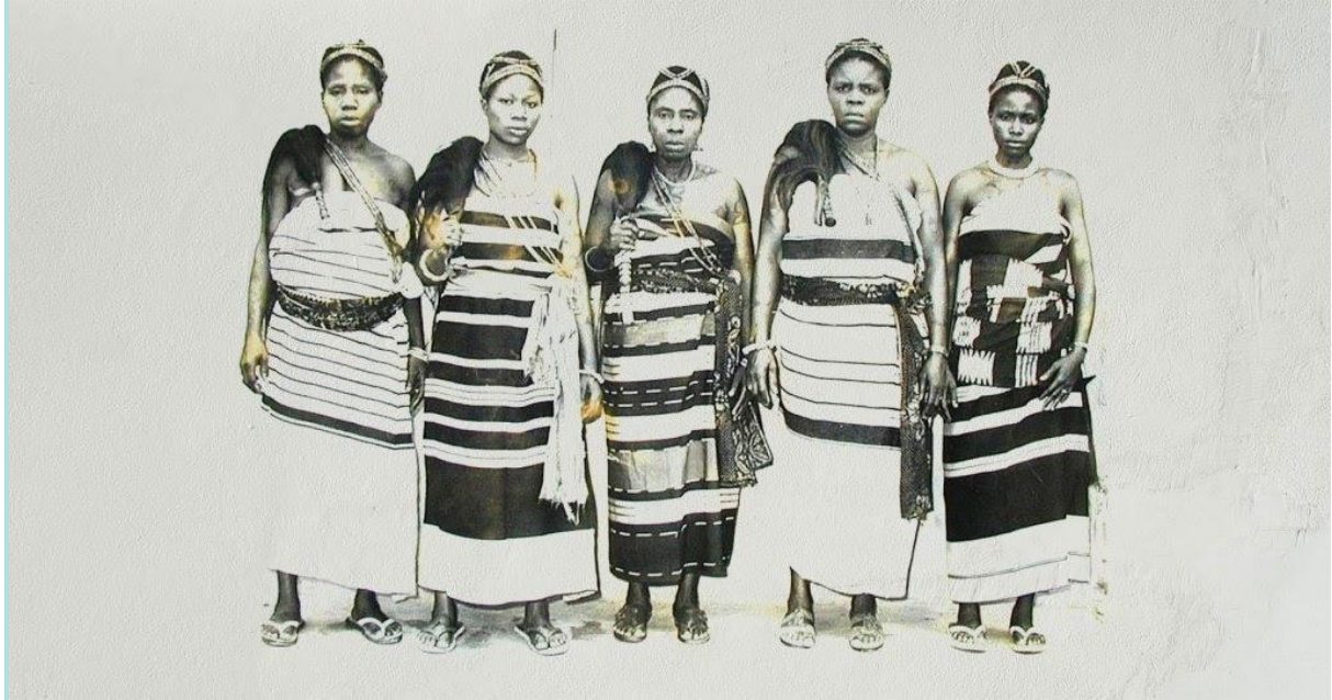
Las nigerianas protestaron en 1929 contra los abusivos impuestos que los británicos impusieron en el mercado. Fotografía de Nwanyereuwa: The Woman Behind The Tactical Aba Women's Protest

De estas últimas protestas, en Abeokuta, sale la idea de crear el grupo AWU (Abeokuta Women's Union) .