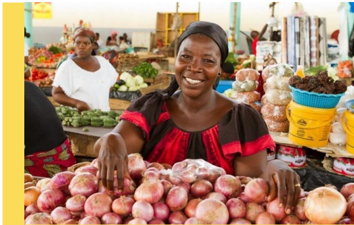
Las mujeres que trabajan en los mercados tradicionales de Nigeria lideraron importantes protestas.

Las mujeres del mercado formaron grupos exclusivos. Para entrar hacía falta tener un nombre femenino y trabajar en los puestos de la plaza . Durante la época colonial, tuvieron que enfrentarse a los abusivos impuestos y el trato desigual por parte de los británicos.