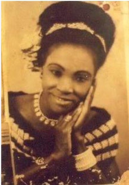
Margaret Ekpo, cofundadora de la Unión Nacional de Mujeres de Nigeria.

Por suerte, tuvo una larga vida y jamás olvidó el activismo político. Al igual que trabajó para visibilizar las minorías étnicas africanas .