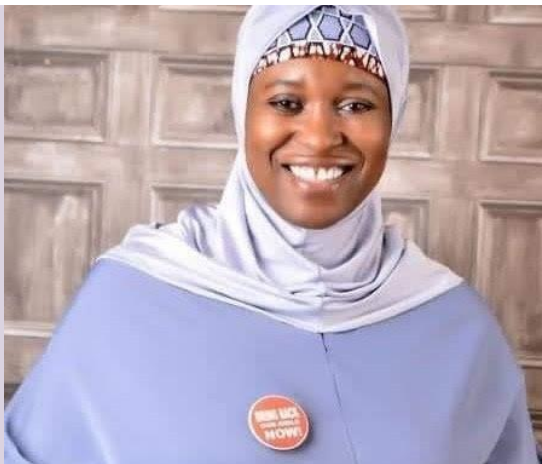
Aisha Yesufu (1978), la activista que empezó la campaña Bring Back Our Girls.

Aisha Yesufu (1978) es una activista social nigeriana que saltó a la fama por su papel al defender a las estudiantes de Chibok , secuestradas en 2014 . Fue la convocante de la campaña Bring Back Our Girls (BBOG) que exigió el regreso de las 276 escolares secuestradas.